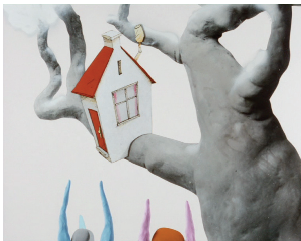
Une Maison de Koji Yamamura