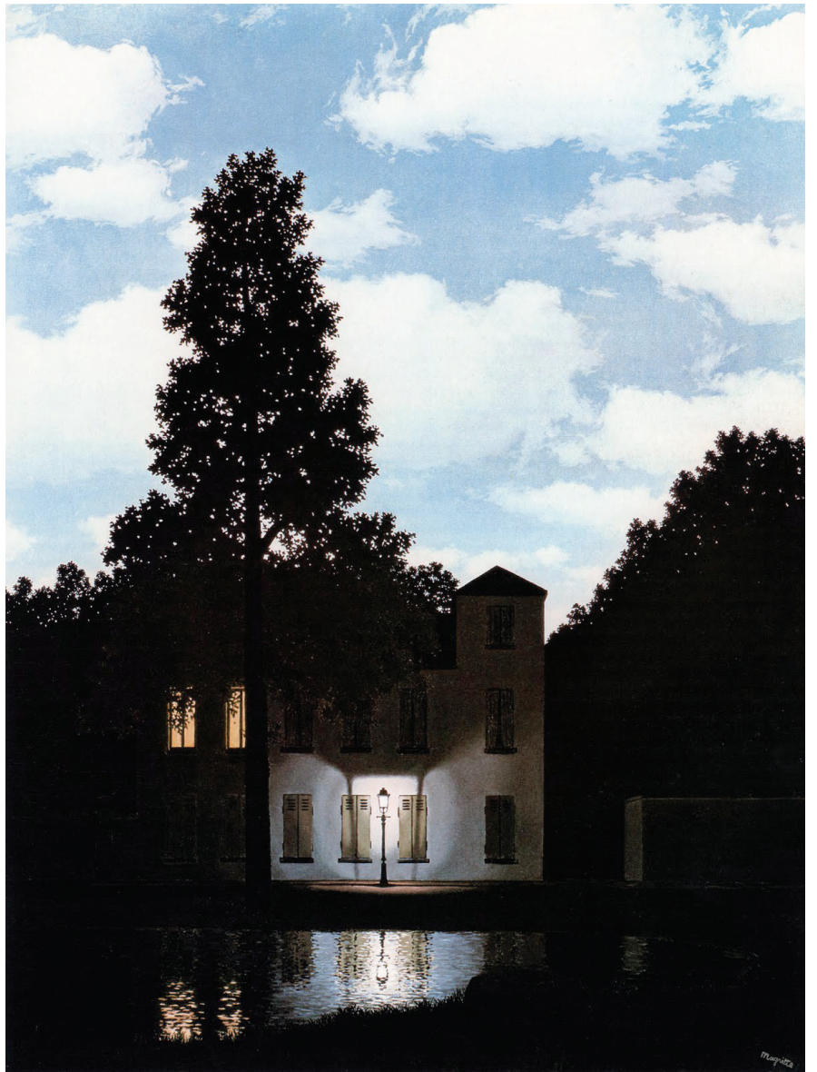
L'Empire des lumières de René Magritte