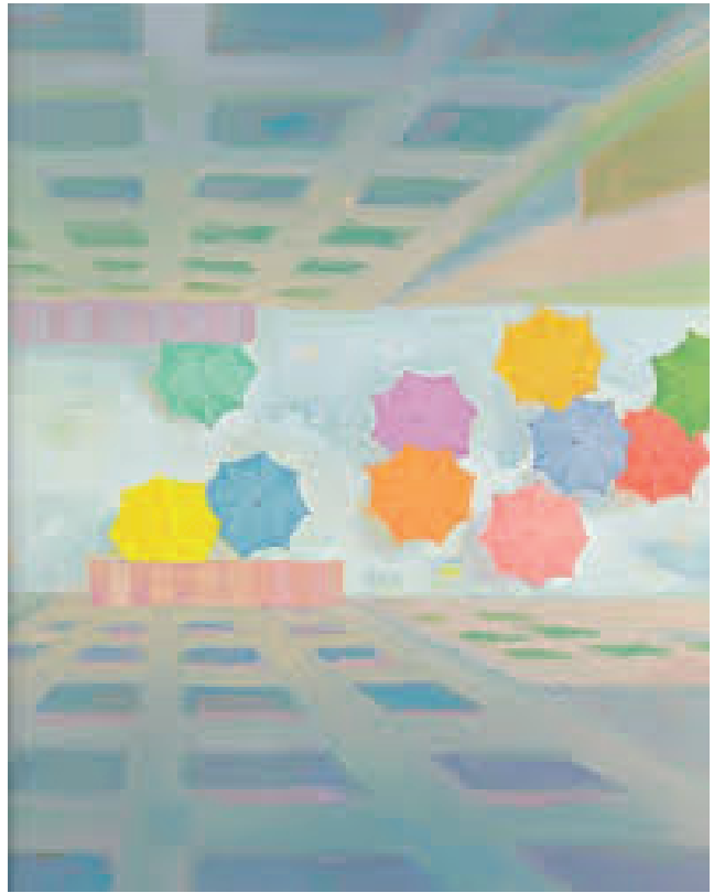
Le Parapluie jaune de Ryu Jae-Soo