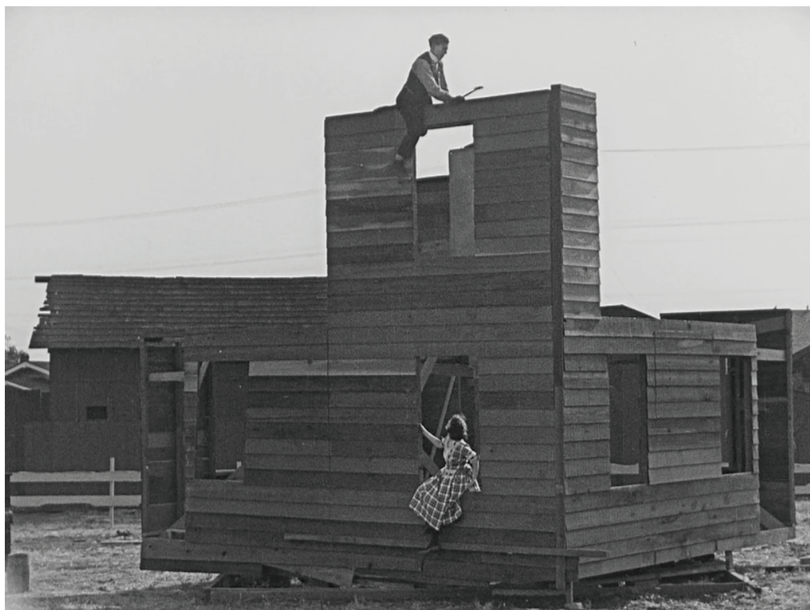
La Maison démontable de Buster Keaton