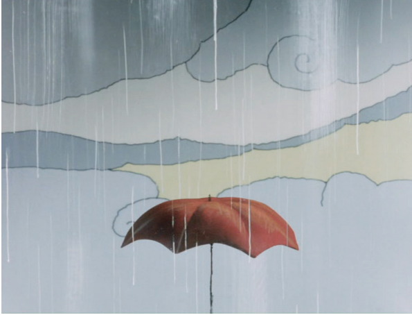
Imagination de Koji Yamamura