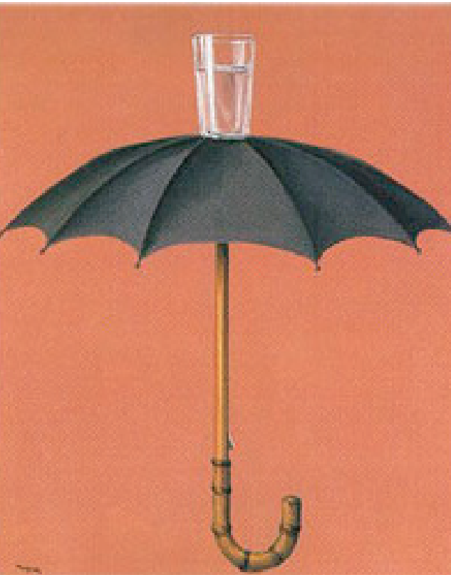
Les Vacances De Hegel de René Magritte