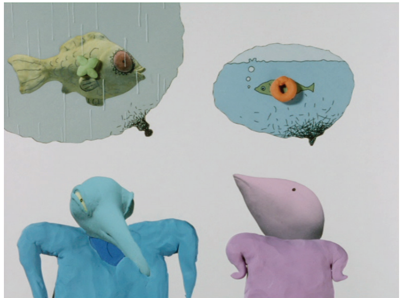
Les poissons volants n'existent pas