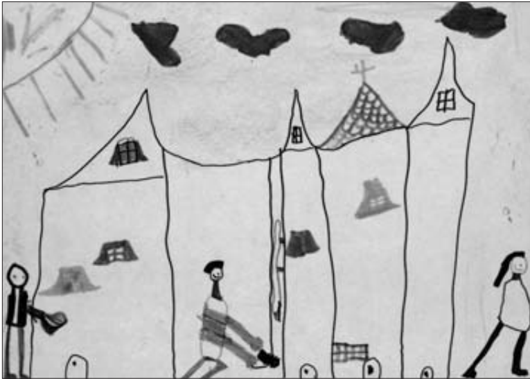
La ville dessinée dans une classe de maternelle après une projection de Katia et le crocodile , au Rex à Chatenay-Malabry.