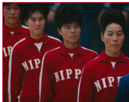
Les Sorcières de l'Orient de Julien Faraut